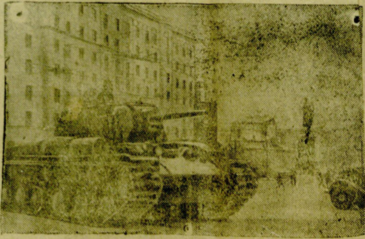
Москва в дни немецко-фашистского наступления. На снимке: Тяжелые танки проходят по площади Пушкина, направляясь на фронт.

Год назад Красная Армия в ожесточенных боях под Москвой разбила немецко-фашистские войска и отбросила их от столицы.